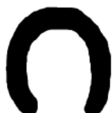
Cheval (fer) 13 cm