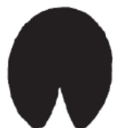
Cheval (ongle) 13 cm

UN ONGLE OU PLUS SOUVENT LA FORME D'UN FER