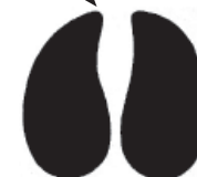
Vache 10 à 12 cm