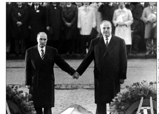
François Mitterrand (1916-1996), et Helmut Kohl (né en 1930), chancelier allemand, se tenant la main au cimetière militaire lors des cérémonies de commémoration de la Première Guerre mondiale, cimetière de Douaumont (France), 22 septembre 1984.