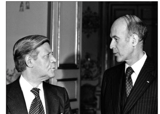
Valéry Giscard d'Estaing, président de la République, s'entretenant avec le chancelier ouest-allemand Helmut Schmidt. Paris, palais de l'Élysée.