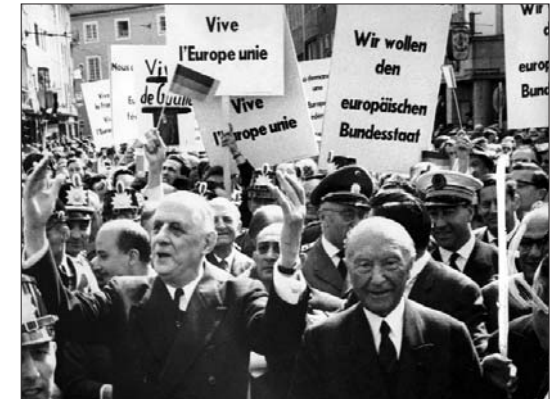
Charles de Gaulle (1890-1970), et Konrad Adenauer (1876-1967), pendant une manifestation en faveur de l'Union européenne et de l'amitié franco-allemande. Bonn (Allemagne), 5 septembre 1962.