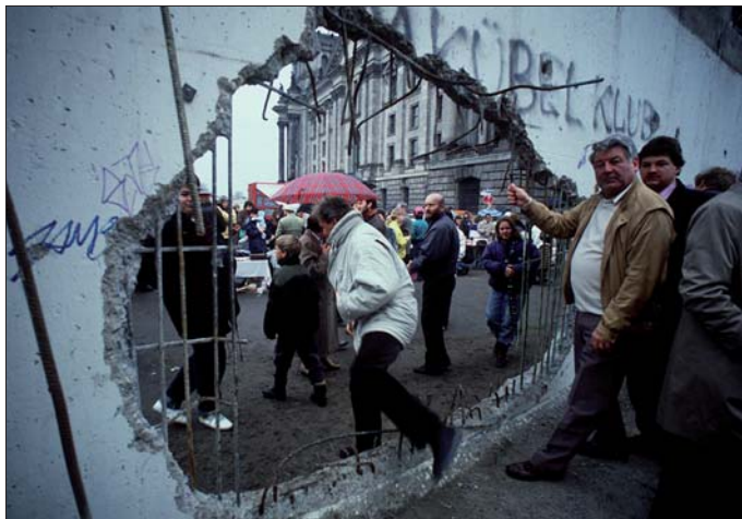
Chute du mur de Berlin, 11 novembre 1989. Ouverture du mur à l'angle de la Bernauer Strasse et de la rue Eberswalder Strasse.

Du temps de la division, les présidents français, en particulier François Mitterrand, ont toujours mené une politique allemande avec un art consommé de l'équilibre : l'année même, en 1983, où Mitterrand prononça un discours resté célèbre devant le Bundestag (le parlement de la République fédérale d'Allemagne), un accord culturel fut signé entre la France et la RDA, l'autre Allemagne antagoniste ; en 1987, trois mois après la création de la brigade franco-allemande avec la RFA, Mitterrand recevait Erich Honecker, premier secrétaire du SED, parti unique de la RDA, à Paris. Bref, malgré les excellents rapports qu'il entretenait avec Helmut Kohl, Mitterrand ménageait en quelque sorte la chèvre et le chou. L'Allemagne, elle, devait se contenter d'un statut mineur.