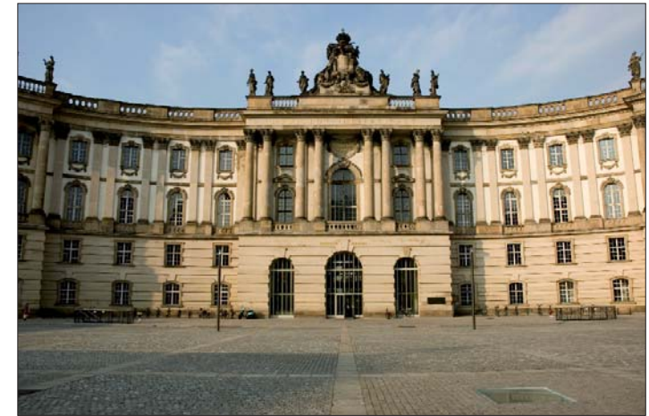
Université Humboldt, Berlin

Le DAAD , Office franco-allemand d'échanges universitaires.