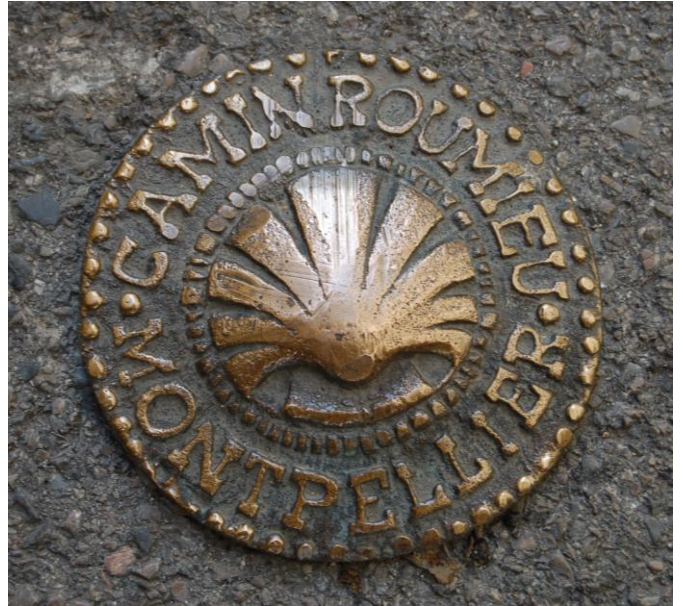
Materializacion de l'ancien camin de Sant-Jaume que traucava la ciutat de Montpelhièr, fotografia G.Arbusset. 2006.

Bibliografia : Jan dau Melhau , Journal d'un pèlerin, vielleux et mendiant, sur le chemin de Compostelle , Edicions dau Chamín de Sent-Jaume, 1990 (1 er édition), Editions Fédérop, 2002 (5 e édition), extraits.