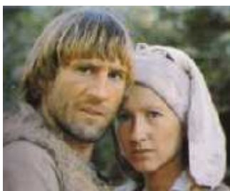
Le Retour de Martin Guerre de Daniel Vigne (1982)

Le plus fantastique des contes de Perrault, revisité par le poète surréaliste.