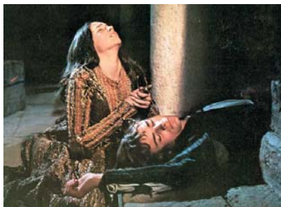
Roméo et Juliette de Franco Zeffirelli (1968)

Un drame paysan nous replonge dans la vie des campagnes françaises au XVIIe siècle.