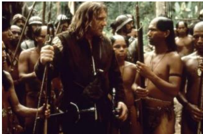
1492, Christophe Colomb de Ridley Scott (1992)

L'histoire du grand navigateur, une fresque épique sur la conquête du nouveau monde et le choc de deux cultures.