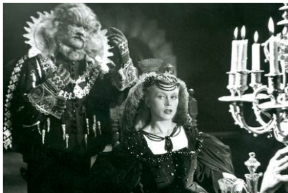
La Belle et la bête de Jean Cocteau (1946)

Le plus fantastique des contes de Perrault, revisité par le poète surréaliste.