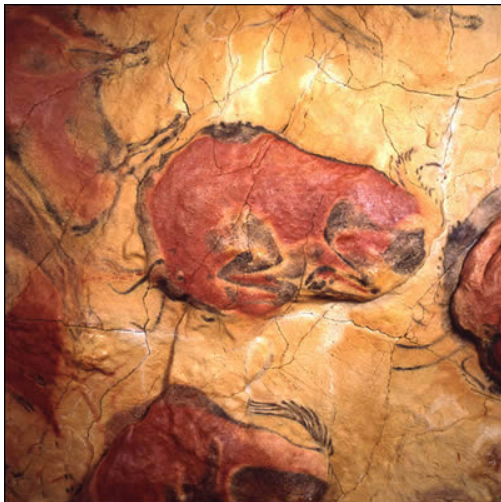
Altamira : Bison couché