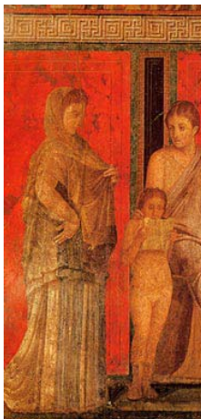
Fresque de Pompéi