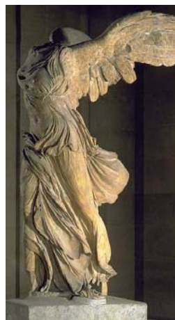
Victoire de Samothrace