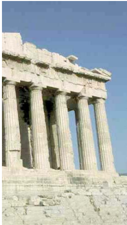
Athènes : le Parthénon

1 – Tableau chronologique de 15 000 avant J.-C. au Ier siècle après J.-C. : Découpez les œuvres d'art et placez-les sur la grille. (Echelle : 1000 ans = 4 cm). Attention : Il vous est conseillé de placer toutes les vignettes avant de les coller.