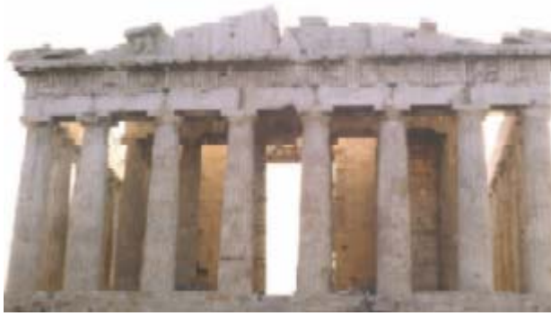
La façade du Parthénon, un chef d'œuvre de l'art grec