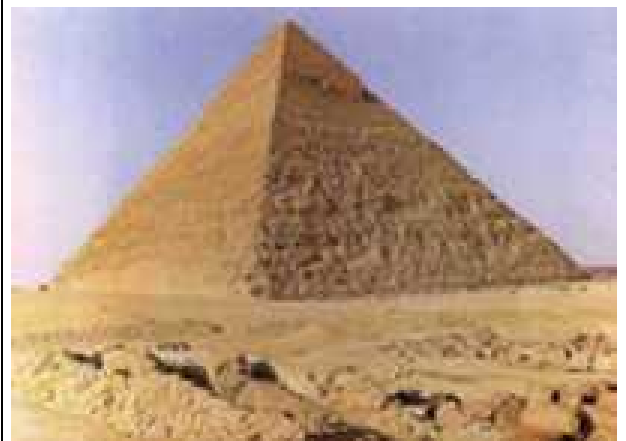
La pyramide de Kheops 2600 av. J.-C., Ghizeh, Egypte