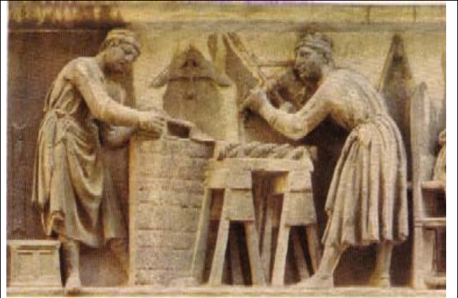
L'atelier des sculpteurs, bas-relief, vers 1412, Florence.

Par contre, au moyen âge, les bâtisseurs de cathédrales utilisaient une règle spéciale, dite des « maîtres de l'œuvre ». Articulée ou rigide, elle comportait 5 parties d'inégales longueurs : la paume, la palme, l'empan, le pied et la coudée. Ces longueurs faisaient référence au corps humain et étaient standardisés, au moins pour les « initiés » : on passe d'une unité à l'autre en multipliant par le nombre d'or... Ainsi une paume plus une palme vaut un empan, une palme plus un empan vaut un pied, un empan plus un pied, une coudée.