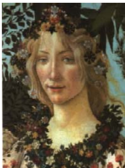
le Printemps, de Botticelli (détail).

La découverte de la perspective procède de cette quête de la réalité. Il faut rendre l'effet de profondeur, il faut situer l'homme par rapport au monde avec les apparences du réel et donner ainsi plus de force au sujet de l'œuvre. Cette quête pour éclairer la relation entre l'Homme et le monde est au centre d'une nouvelle mentalité plus abstraite, plus organisée, plus scientifique, plus enracinée. C'est le cœur du projet des humanistes.