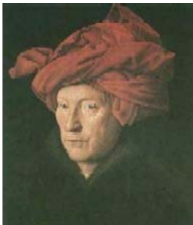
L'homme au turban rouge, de Van Eyck.

Le début du XVe siècle ouvre le temps de la conquête de la réalité pour atteindre un idéal de beauté. Un profond besoin de naturalisme pousse à s'inspirer de l'art antique qui, pour les hommes du temps, est intimement lié à la science et au savoir. L'œuvre d'art doit être le reflet du monde visible, l'artiste doit être fidèle à ce que l'œil voit. La technique nouvelle de la peinture à l'huile inventée par Jan van Eyck donnent de l'espace, des surfaces, des volumes, des effets de lumière et de la transparence une image vraisemblable. C'est bien l'évolution des sensibilités qui amène ces changements. La quête d'un idéal provoque la découverte de nouvelles méthodes, l'art exprime le progrès dans son souci d'être au plus près du Vrai. Pour cela, le miroir est ici emblématique de la mutation, avec la Renaissance devenu signe de pureté, il est une fenêtre ouverte sur le réel, sur la vie, il attire le regard, il ouvre sur l'espace du monde humain. C'est une rupture d'avec le Moyen-Age, où il incarnait la mort.