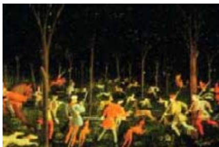
La chasse, de Paolo Uccello.