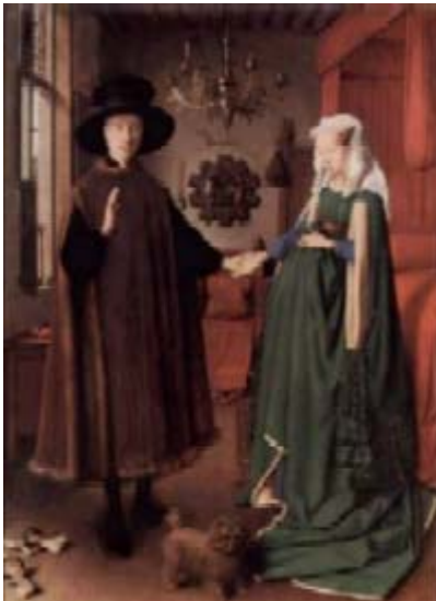
Les époux Arnolfini, de Jan Van Eyck. (détail du miroir en haut de la page).

Le Beau n'est qu'un but de l'Art. Sa plus haute ambition est de nourrir un dépassement pour le spectateur, de lui ouvrir les yeux et l'esprit au savoir, aux idées et aux valeurs. Cela, la Renaissance le dévoile à la perfection. Avec elle, une autre conception de la vie et de la réalité imprègnent la vision de l'humanité. L'art joue un rôle majeur pour exprimer la substance de cette nouvelle image de la beauté. Dans ce vaste mouvement intellectuel de trois siècles, du XIVe au XVIe siècle, dont le nom de Renaissance est forgé par la pensée et la plume des humanistes, un autre rapport à la vie trouve son expression dans l'art. Par lui, une nouvelle image de l'Homme s'impose peu à peu au plus grand nombre.