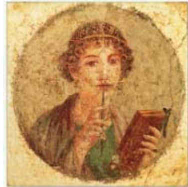
Portrait de jeune fille, Musée de Naples

L'art des Romains s'enracine dans celui des Grecs, mais il dépasse la simple volonté d'atteindre le beau en représentant pleinement la nature. L'art de la fresque et celui du portrait tout particulièrement révèlent cette originalité. L'artiste romain montre le vrai, mais avec tous les traits de caractère du sujet représenté.