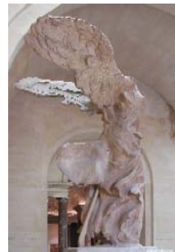
La victoire de Samothrace