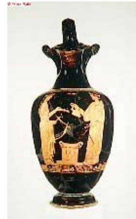
Apollon tend une coupe à une musicienne