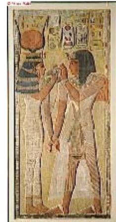
Sethi Ier et Hathor