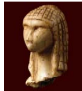
La Vénus de Brassempouy

Au travers de ces constantes pour la figuration humaine, l'art du paléolithique supérieur se développe tout au long de la chronologie de l'aurignacien au magdalénien, de -30000 à -10000.