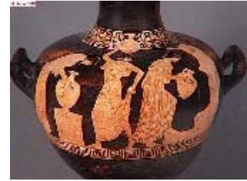
Jeunes filles à la fontaine

Avec l'art hellénistique, la Grèce livre au monde sa figuration de l'humanité, mais les sculpteurs s'intéressent plus au rendu du mouvement dans l'espace. La Victoire de Samothrace, vêtements animés par le vent, et plaqués au corps comme mouillés, paraît portée dans les airs par les dieux. Alexandre le Grand, avec son empire, construit une cité unique où l'Europe se mêle à l'Europe se mêle à l'Asie, l'art des Grecs s'adresse à toutes les cultures, à tous les peuples, et leur permet l'expression. Ainsi est la civilisation hellénistique: profondément cosmopolite, mais partout le voyageur rencontre des paysages familiers. Rome va prolonger et achever cette œuvre.