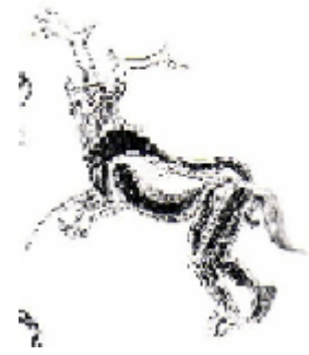
Le sorcier de la grotte des Trois frères

Avec l'aurignacien, le corps humain est seulement représenté par une de ses parties, notamment des vulves féminines. Le gravetien et le périgordien révèlent une intense production de statuettes féminines ou de figurations en bas-relief. Beaucoup ont une forme losangique, la tête est parfois absente ou très schématisée, il en est de même pour les membres inférieurs, les bras sont absents et souvent ventre, fesses et seins sont hypertrophiés. Une ampleur toute particulière est donnée aux caractères sexuels. A partir du solutréen, et surtout avec le magdalénien, la figuration humaine devient d'une plus grande variété. Les représentations féminines prédominent toujours, très stylisées, mais moins déformées et opulentes, que ce soit pour les gravures ou les statuettes. Les figurations masculines, elles, sont intégrées à des scènes de chasse et apparaissent souvent déguisées, avec des peaux munies de cornes ou avec des masques d'animaux.