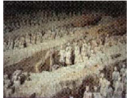
L'armée des fantassins

6000 guerriers en terre cuite veillent sur le tumulus funéraire de l'empereur Qin Shi Huangdi. Cette armée vue en vol d'oiseau livre la perspective propre à l'art chinois. Un art impérial est né, profondément réaliste.