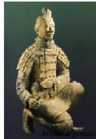
Archer à genoux

L'armée de l'empereur Qin et l'art funéraire sont les plus représentatifs de cette conception artistique qui cherche la pérennité, mais au travers du mouvement. Ainsi un modèle profondément original se développe en Extrême-Orient, que sa conception de la figure humaine révèle mieux que tout.