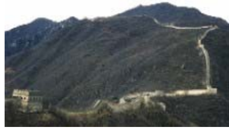
La grande muraille

Au III e siècle avant notre ère, le pouvoir impérial des Qin unifie un vaste ensemble territorial qui va prendre leur nom: la Chine, et que l'Occident connaît par les soieries. Un état centralisé s'installe, protégé des nomades du Nord par la Grande Muraille.