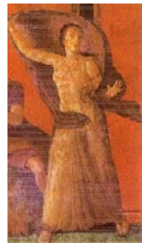
Femme saisie de terreur, villa des mystères, Pompéi

L'intention est de montrer au spectateur que le mystère dionysiaque se déroule réellement. L'artiste veut provoquer le sentiment de participer à cette scène avec le même effroi des personnages. Cet accent baroque, ce dépassement de la mesure, distingue l'art romain.