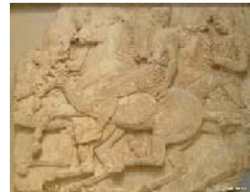
La frise des Panathénées