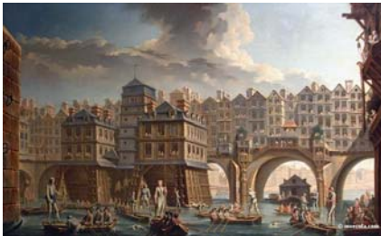
Joutes devant le pont Notre-Dame, de Jean-Baptiste Raguenet (1756)

Du temps de Watteau, la boutique du marchand de tableaux Gersaint était installée sur le pont Notre-Dame. A cette époque, de nombreux ponts de Paris étaient bâtis de maisons de bois. Le premier pont sans maisons fut le Pont-Neuf, inauguré en 1607.