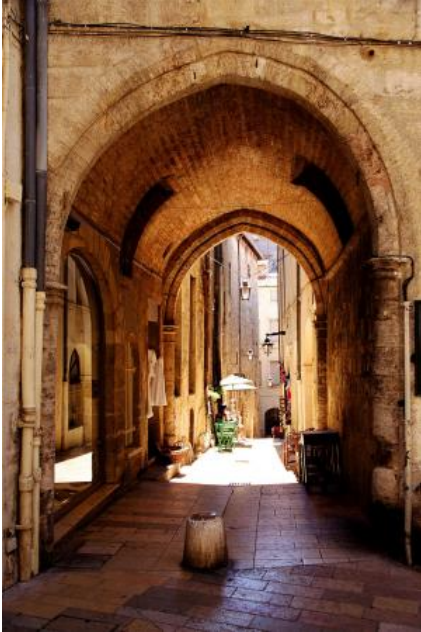
Une rue du vieux Montpellier