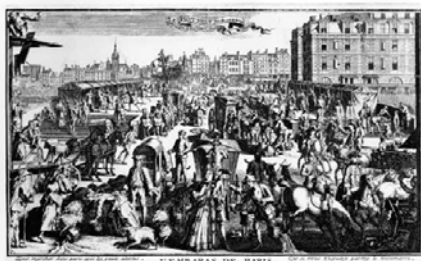
Embarras de Paris, de Nicolas Guérard (gravure du XVIIIe siècle)

Au XVIIIe siècle, Paris connaît un formidable essor économique et démographique. Les gens arrivent de plus en plus nombreux de la campagne et la ville compte à la fin du siècle plus de 650 000 habitants.