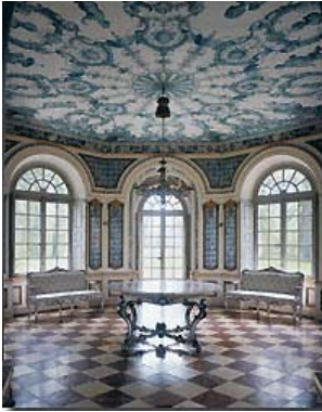
Pavillon de chasse du château de Nymphenburg