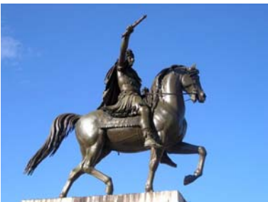
La statue équestre de Louis XIV