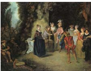
L'Amour au théâtre français (1720)

Visualisation d'une cassette, ou d'un spectacle.