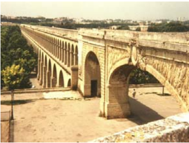
L'aqueduc du Peyrou