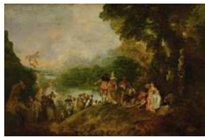
L'Embarquement pour Cythère (1717)

Les spectateurs votent pour la meilleure improvisation.