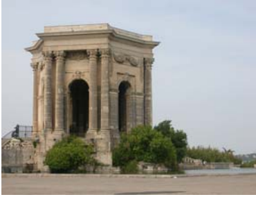
Le château d'eau du Peyrou