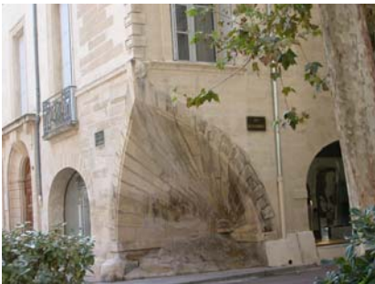
Rue de la Coquille, Montpellier (XVI e siècle)