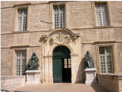
Faculté de médecine, Montpellier (XVII e siècle)

I – A partir d'une photographie de porche ou de fenêtre prise dans le cœur de ville, réalisez une maquette en bas-relief avec de la pâte à sel.