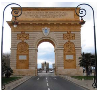
L'arc de triomphe, Montpellier