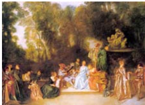
Récréation galante (1717)

Réécrivez le passage « Pour se dégourdir les doigts... boutique » (p. 105) au style direct comme si Watteau se parlait à lui-même.